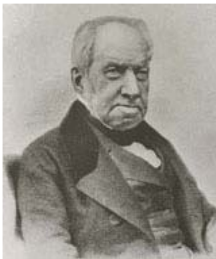
Роберт БРОУН Robert Brown, 1773–1858

Летом 1827 года Броун проводил исследования пыльцы растений. Он, в частности, интересовался, как пыльца участвует в процессе оплодотворения. Как-то он разглядывал под обычным микроскопом выделенные из клеток пыльцы североамериканского растения Clarkia pulchella (кларкии хорошенькой) взвешенные в воде удлинённые цитоплазматические зерна. Неожиданно Броун увидел, что мельчайшие твердые крупинки, которые едва можно было разглядеть в капле воды, непрерывно дрожат и передвигаются с места на место. Он установил, что эти движе-